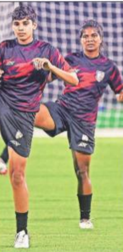
भुवनेश्वर में फीफा महिला अंडर 17 विश्व कप के दूसरे ग्रुप मैच से पहले गुरुवार को अभ्यास सत्र में भाग लेती भारतीय टीम की सदस्य।